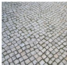
Calçada de Vidraça

Os revestimentos escolhidos para os pavimentos são: