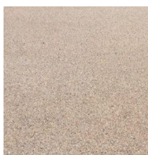
Caminha pedonal em resina sintética