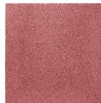
Piso do Parque infantil em borracha in situ